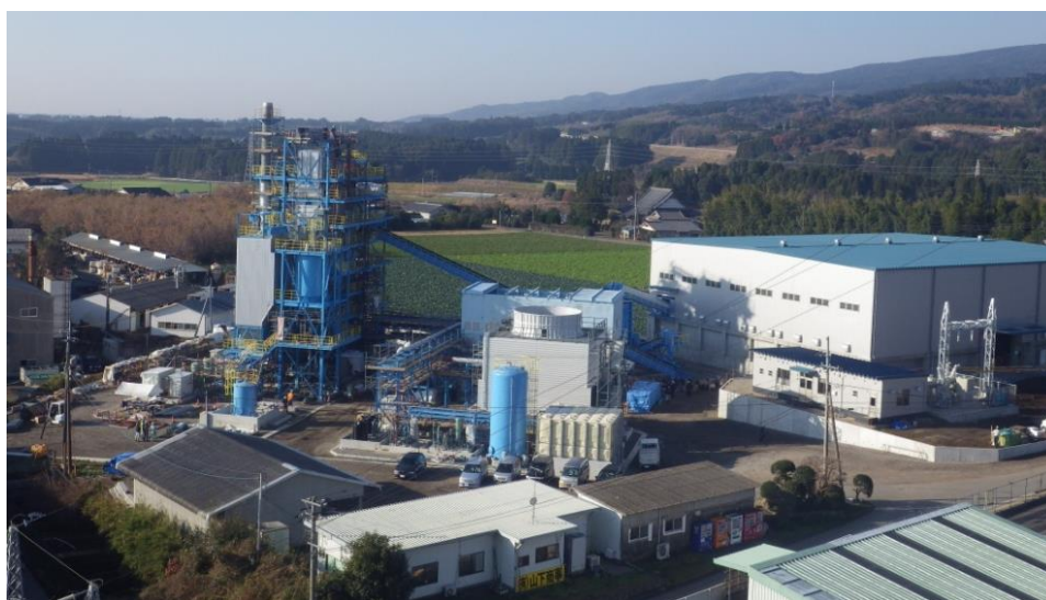
(宮崎森林発電所 全景写真)