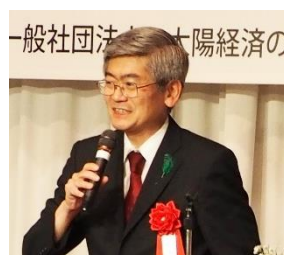
牧元幸司様 林野庁林政部長 (前宮崎県副知事)