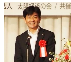
日高昭彦様 川南町長