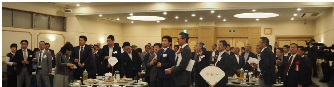
(写真:懇親会の様子)

若い世代、女性、みんなで農業を儲かる稼げる近代産業にしたい。議論して一歩踏み出すことが大切です。ありがとうございました。