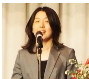
江藤順子様 衆議院議員 江藤拓様の代理 代議士夫人